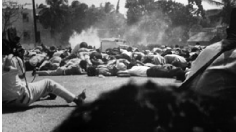
Los ciudadanos tuvieron que echarse al suelo al escuchar la detonación de armas de largo alcance y bombas lacrimógenas.

Tropas estadounidenses invadieron el 29 de abril a República Dominicana, con el pretexto de "proteger a sus ciudadanos" de la guerra civil que se libraba en ese país. Una crisis política se desató en la isla, luego del derrocamiento del presidente Donald Reid Cabral por un golpe militar dirigido por el coronel Francisco Caamaño Deñó, el pasado 24 de abril. La salida de Reid Cabral llevó a la radicalización de las posiciones políticas, las cuales se pusieron de manifiesto en la conformación del grupo llamado "Gobierno Constitucional", dirigido por el coronel Caamaño Deñó e integrado por los seguidores del otrora presidente Juan Bosch; y del grupo en el cual