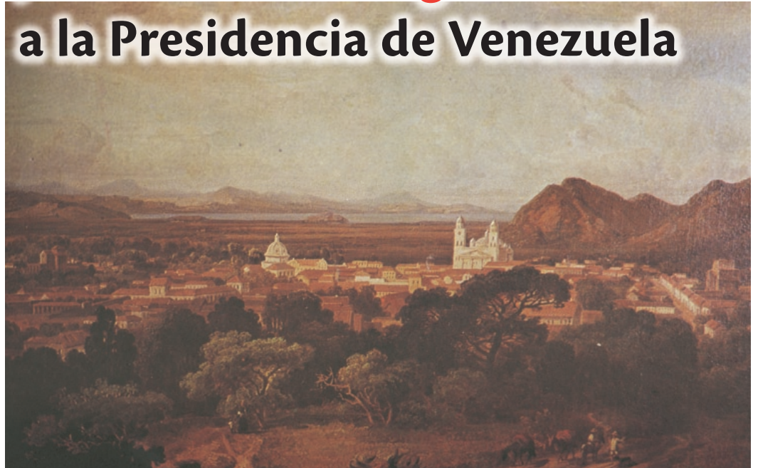
Vista de la ciudad de Valencia, donde ocurrió la revuelta contra el Monagato

La dimisión del mandatario fue provocada por la revolución iniciada en Valencia, los rumores de la conformación de un ejército y por el descontento general de la población